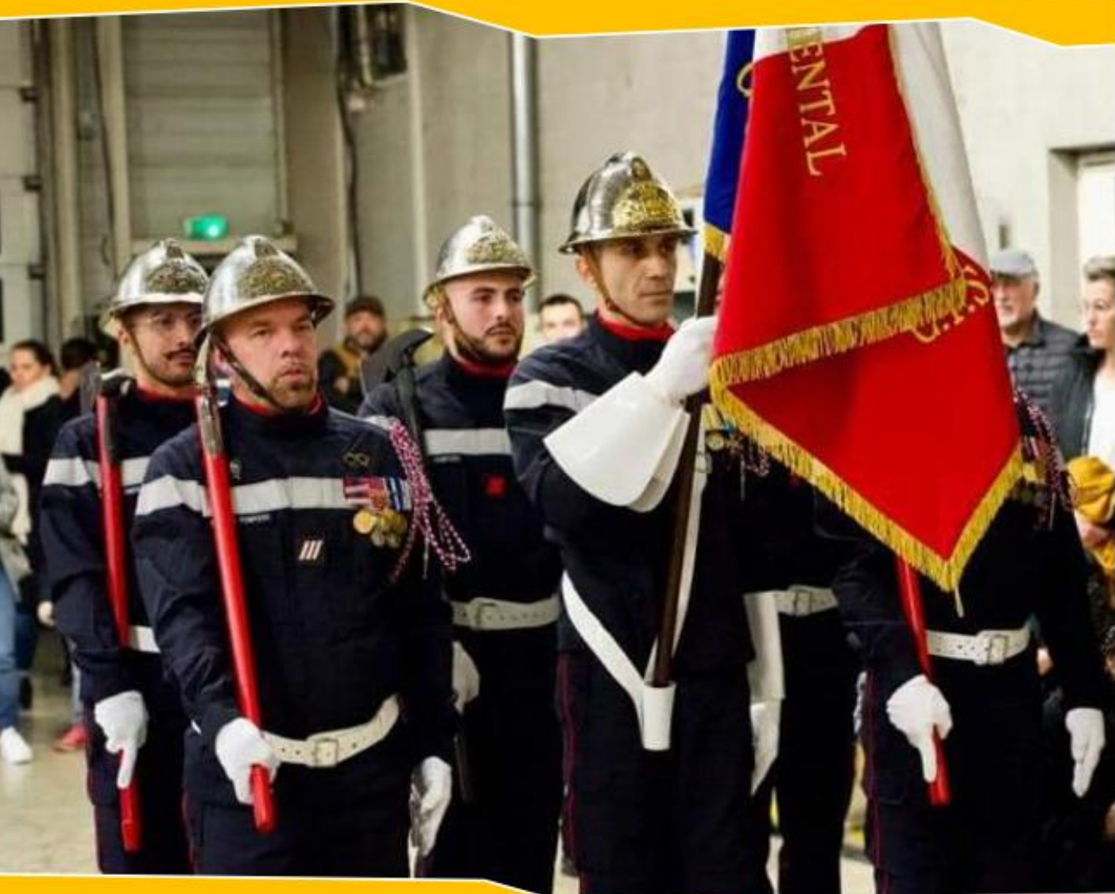
Photo : Cérémonie de la Sainte Barbe 2023 au Centre de Secours de Marguerittes