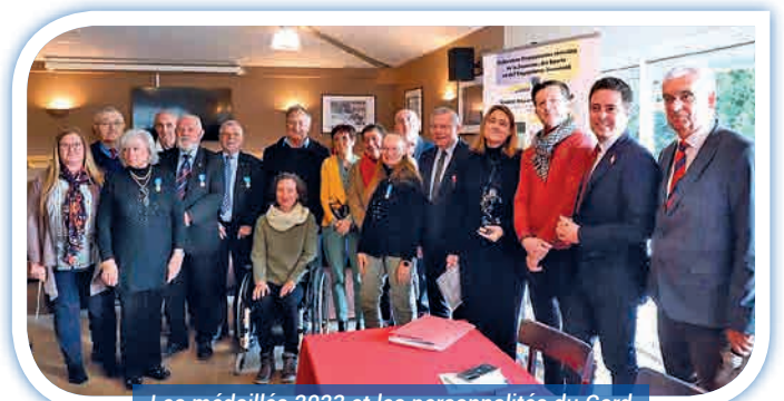
Les médaillés 2023 et les personnalités du Gard