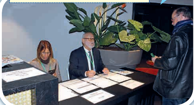
Dès 14 heures, les participants étaient invités à se présenter aux tables de pointage pour l'émergence.