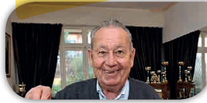
La Dépêche du Midi - 19 août 2018