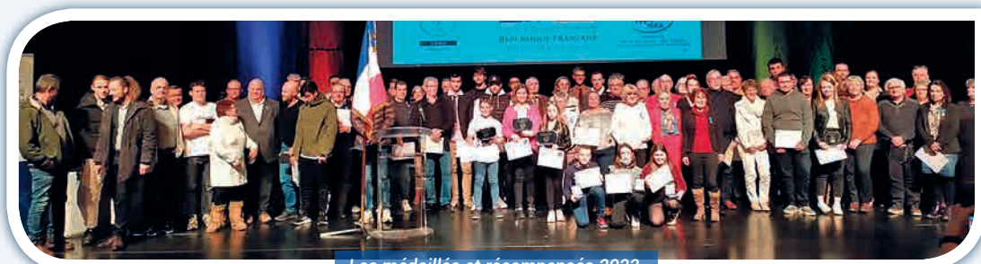
Les médaillés et récompensés 2022.