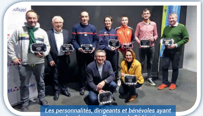
Les personnalités, dirigeants et bénévoles ayant reçu les plateaux offerts par la Fédération.

Après les photos traditionnelles des récipiendaires cette soirée chaleureuse et conviviale s'est clôturée par un cocktail offert par la Ville de Cossé le Vivien.