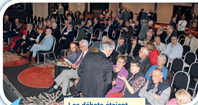
Les débats étaient ouverts, francs, animés, chacun s'exprimait librement.