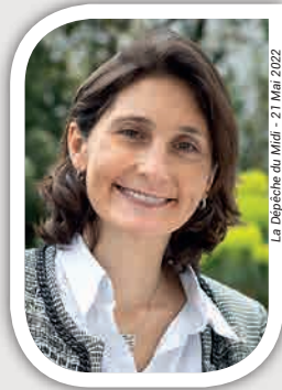
La Dépêche du Midi - 21 Mai 2022

C'est d'autant plus essentiel qu'avec l'organisation de la Coupe du monde de rugby à l'automne, et, a fortiori, celle des Jeux de Paris 2024, nous aurons besoin de tout le savoir-faire, l'expérience et l'engagement du bénévolat