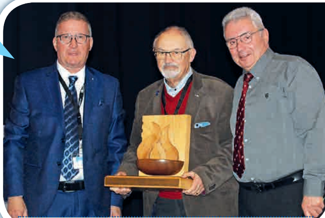
Pour le passage de flambeau (sculpture en bois), Royat laisse sa place à Vannes pour le 73 e congrès 2024 (vraisemblablement en avril, à confirmer).

La démocratie s'était invitée dans la salle, après des interventions étayées, le bilan prévisionnel n'était finalement pas proposé au vote. Quant aux questions diverses non inscrites à l'ordre du jour, elles y étaient ajoutées.