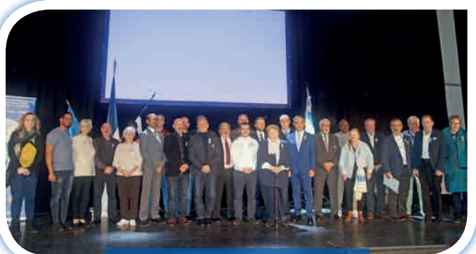
Photo des récipiendaires du 20 janvier