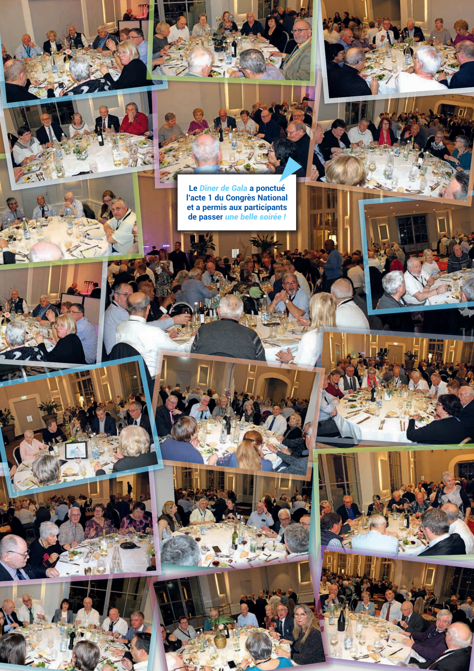
Le Dîner de Gala a ponctué l'acte 1 du Congrès National et a permis aux participants de passer une belle soirée !