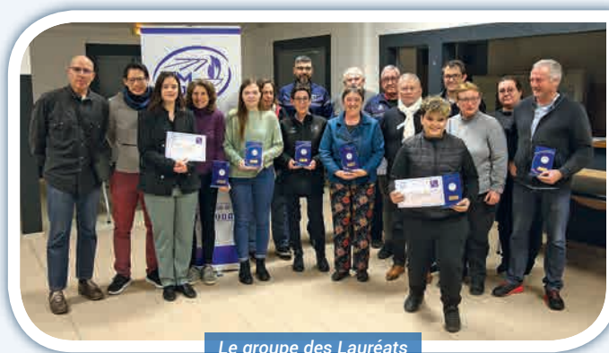
Le groupe des Lauréats