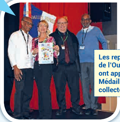
Les représentants de l'Outre-Mers ont apprécié le Médaillé n°100 collector.