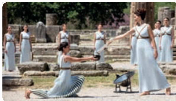
Sur le site antique d'Olympie...

En - 776, date de la naissance officielle des Jeux olympiques, ce fut Coroïbos qui remporta cette unique épreuve (ce ne fut qu'un demi-siècle plus tard que d'autres épreuves vinrent étoffer un programme qui s'étendit sur cinq jours (le double stade, la longue course, la lutte, le pentathlon, le pugilat, la course de chars, la course de chevaux et le pancrace aux 33 es ).