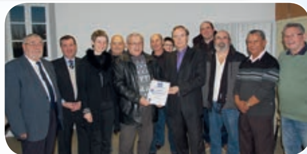
Le comité départemental de cyclisme a reçu le diplôme de l'Association Française Sports sans Violence et Fair-Play.