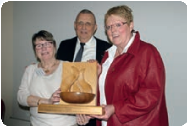
Passation de la flamme