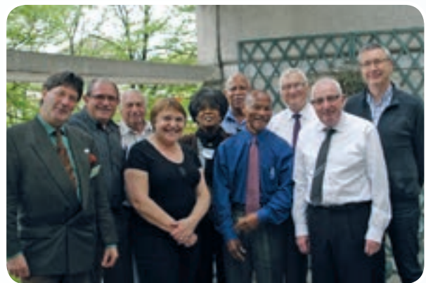
La Bretagne toujours bien entourée !