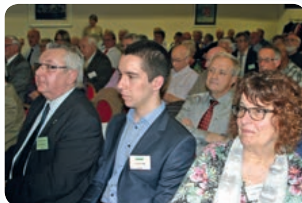
... de part et d'autre !