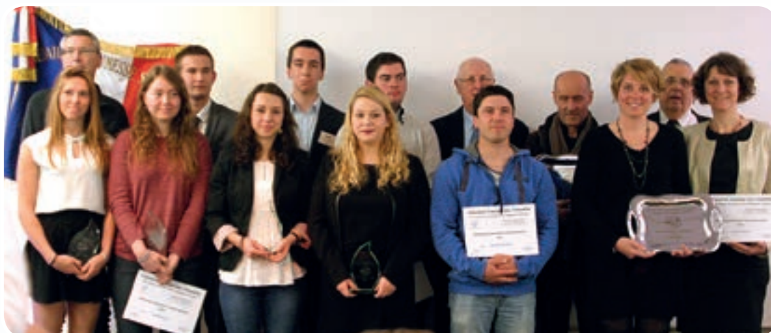
Ensemble des challenges Nationaux