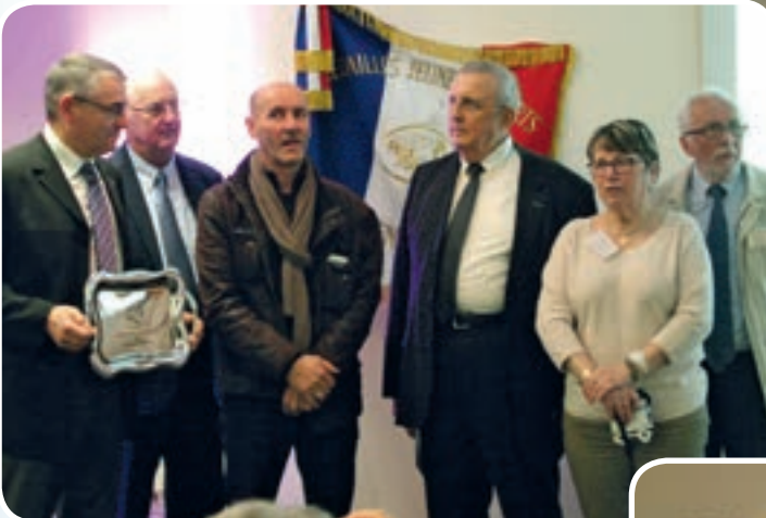
Les Dragons de la Route