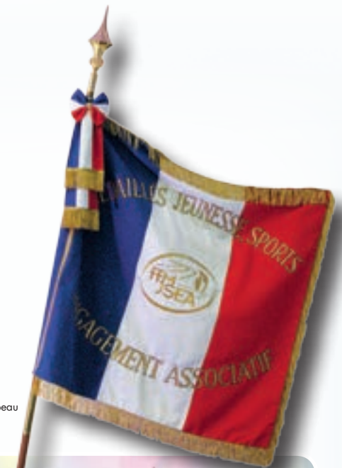
Notre nouveau drapeau