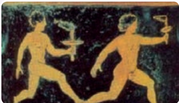
Représentation antique d'une lampadédromie

Elle est, avec l'appellation même d'olympique, le principal trait d'union entre l'Antiquité et l'ère moderne. Issue du mythe Prométhéen, elle est un symbole qui fait appel aux représentations culturelles, et le plus souvent mystiques, de l'élément feu, source du progrès et de la destruction.