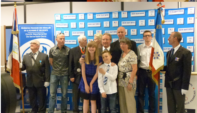
La photo de Famille du photographe Hady