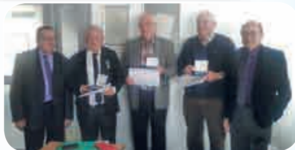
Les récipiendaires de la reconnaissance fédérale