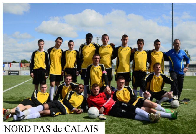
NORD PAS de CALAIS

Le C.D.S.A. 18 a vivement remercié toutes les différentes associations pour leur soutien lors de ces 3 jours de compétition dont le Comité du Cher des Médailleurs qui comme chaque année participe pleinement à la réussite des manifestations organisées pour le sport adapté.