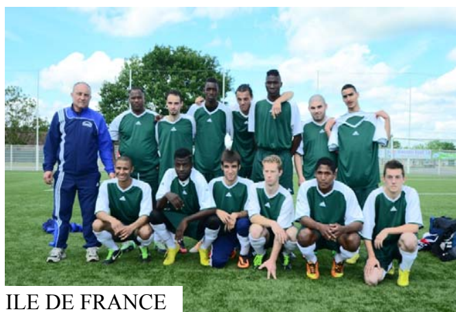
ILE DE FRANCE

Le vendredi 9, dès 9 h 00 se sont déroulés les matches de classification, avec le contrôle des feuilles de matches par les membres des médaillés présents.