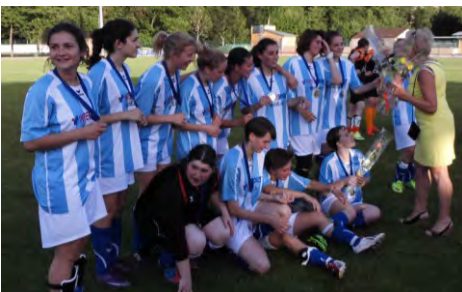
Coupe Lozère de football féminin - juin 2014.