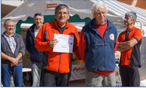
Diplôme du Bénévolat lors des Virades de l'Espoir à Langogne.