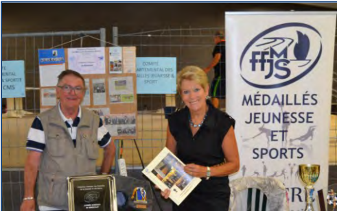
Forum des associations à Mende - septembre 2014.