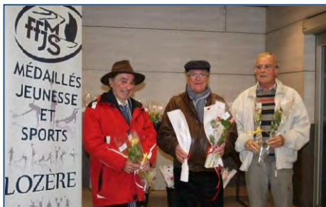
30 ans du CDOS - novembre 2014.