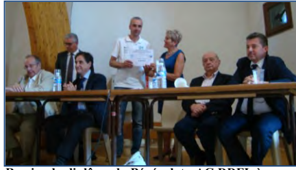
Remise du diplôme du Bénévolat - AG DDFL à Rioutort-de-Randon, le 28 juin 2014.