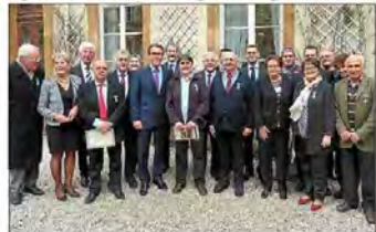
Le groupe des médaillés de cette cérémonie avec les personnalités.

Cérémonie Les médaillés Jeunesse et Sport en assemblée puis en préfecture.