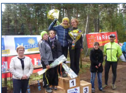
Remise des prix aux féminines du Vétathlon de Mende.