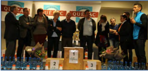
Remise des prix de La Canourguaise - mars 2014.