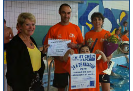
24 H de natation à St-Chély - avril 2014.