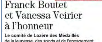
Le comité de Lozère des Médailles de la jeunesse, des sports et de l'engagement

Midi Libre | midilibre.fr MARDI 4 NOVEMBRE 2014 | C1