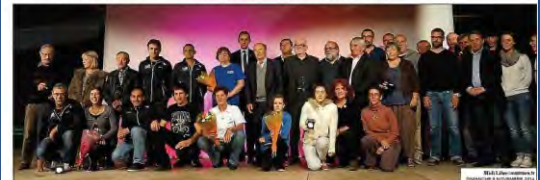
■ La grande famille des sportifs lozériens s'est réunie ce vendredi pour l'occasion. Ce n'est pas tous les jours que l'on a 30 ans !

Une soirée marquée aussi par divers sports pratiqués en Lozère: natation, équitation, football, karaté, athlétisme, badminton, sans oublier les sports adaptés car « l'essence même du sport, c'est l'acceptation de l'autre ». Une belle effervescence qui prouve une fois encore le dynamisme des associations sportives et l'implication sans faille des bénévoles.