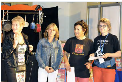
Remise de diplômes du Bénévolat, lors du Festival « Du Môme ô Cœur », à Badaroux.