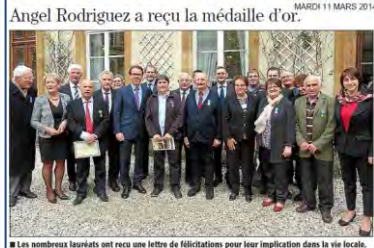
Les nombreux lauréats ont reçu une lettre de félicitations pour leur implication dans la vie locale.

Midi Libre | midilibre.fr MARDI 11 MARS 2014