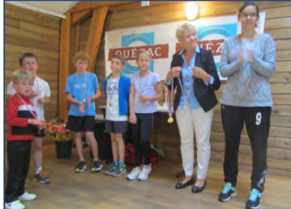
Course de la Bastide - septembre 2014.