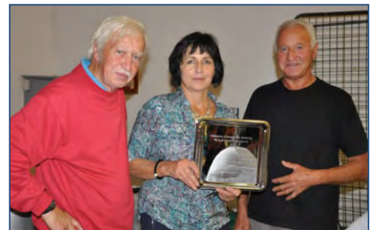
Run nature à Naussac, avec une remise de plateau du Bénévolat.