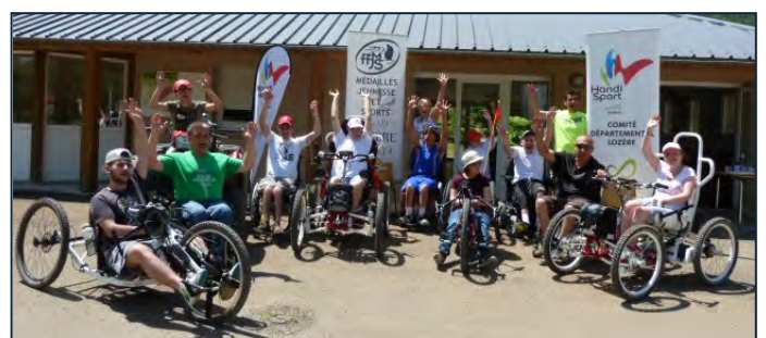
Rassemblement Handisport juin 2014.