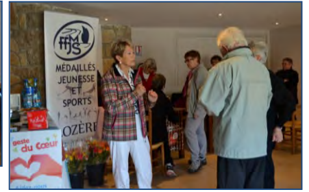
Parcours du Cœur à Chanac - avril 2014.