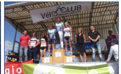
Championnat Ecole de cyclisme - juin 2014.