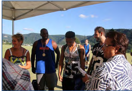
Tournoi de basket à Mende - septembre 2014.