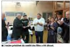
■ L'ancien président du comité des fêtes a été décoré.