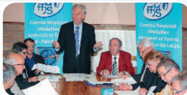
Le Président Roland LOOSES entouré des Membres de l'Instance Dirigeante des deux Comités Départementaux