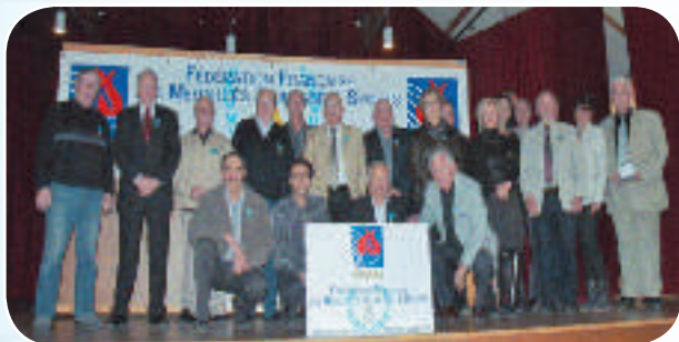
Quatre médailles d'or, sept d'argent et quinze de bronze obtenues tant au plan départemental, que régional et national ont ensuite été remises. Si l'on y ajoute trente six lettres de félicitations et soixante dix huit diplômes de Lauréats Sportifs remis lors d'une cérémonie précédente, cela fait cent quarante bénévoles qui ont été honorés en 2014 et autant de candidats susceptibles d'adhérer à notre association... Et la cérémonie s'est clôturée autour du verre de l'amitié et a permis encore de nombreux échanges entre sportifs et associatifs issus d'activités différentes.