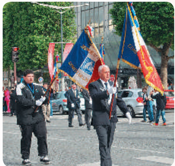
Drapeau de notre Comité porté par un jeune rugbyman massicois

Cette cérémonie montre combien la transmission de notre mémoire est importante pour cette jeune génération. De plus, s'agissant de jeunes sportifs, les Médailleurs de la Jeunesse et des Sports ont pleinement leur place pour l'organisation d'une telle manifesta-