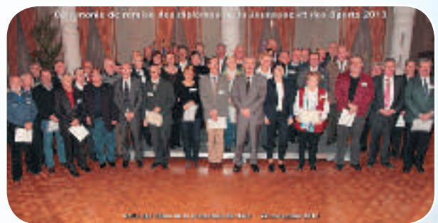
Cette cérémonie s'est déroulée le 22 novembre dans la superbe salle des fêtes de la Préfecture du Nord en présence de nombreux élus.