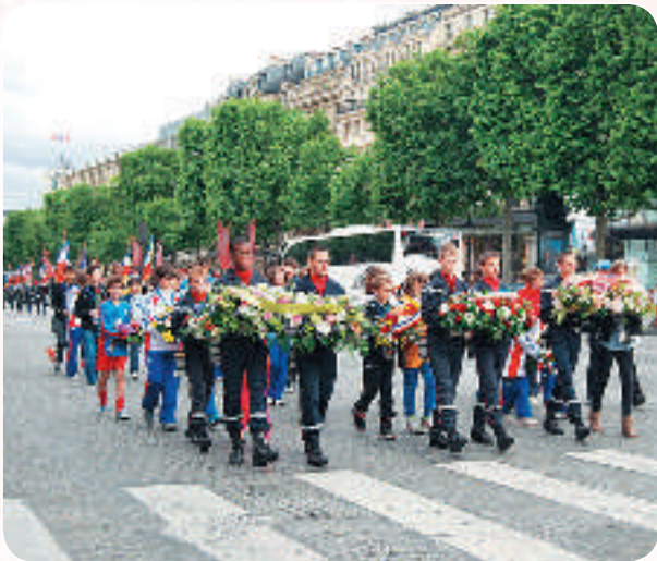
Défilé des jeunes sportifs porteurs des gerbes

Depuis plusieurs années, le Comité de Paris des Médailleurs de la Jeunesse et des Sports, en collaboration avec le Comité régional d'Île de France organise le ravivage de la flamme sous l'Arc de Triomphe dans le cadre d'une journée « Jeunesse et Citoyenneté ».