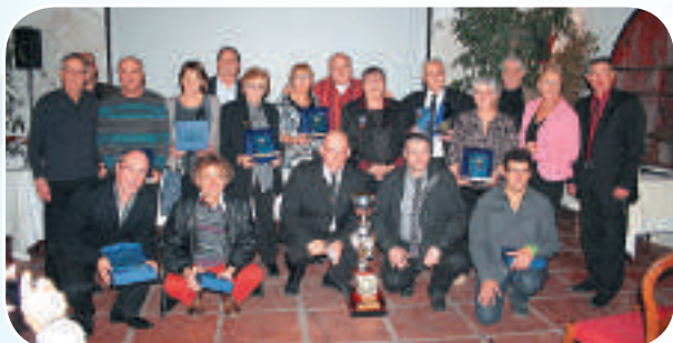
La « photo de famille » tirée, toute l'assistance s'est retrouvée autour du verre de l'amitié offert par le dynamique Comité Régional.