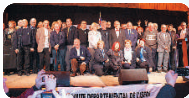
Une belle assemblée de bénévoles