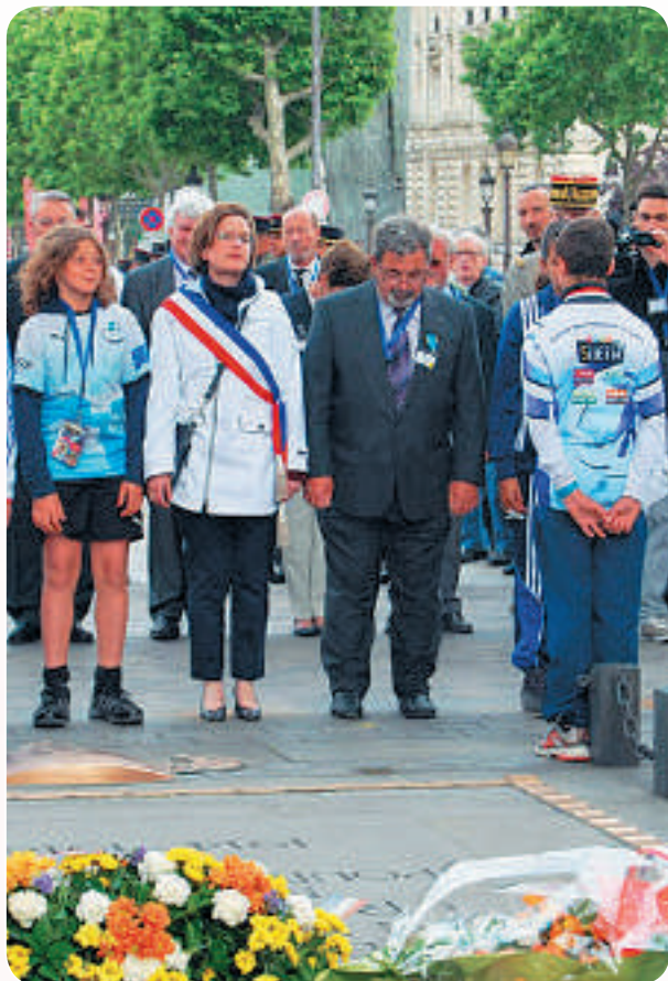
Recueillement de la maire-adjointe de Massy et du président départemental