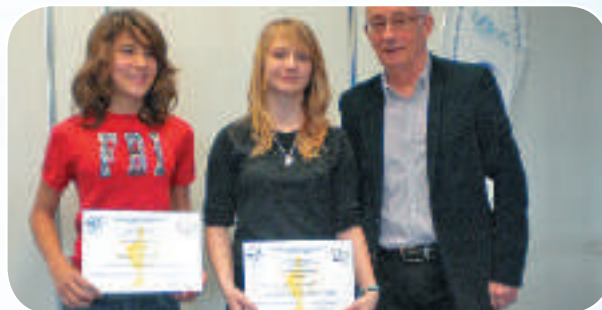
La remise des challenges départementaux à 2 jeunes championnes minime et cadette haltérophiles du Narbonne Haltéro s'est effectuée lors de cette assemblée générale.