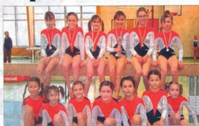
La gymnastique, avec notamment l'Espoir gymnique, fait partie des sports les plus anciens à Nivolas-Vermelle.