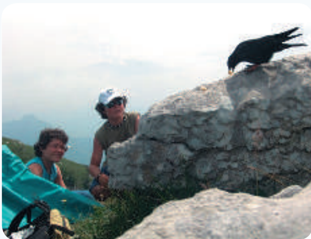
Respect de la faune et de la flore.