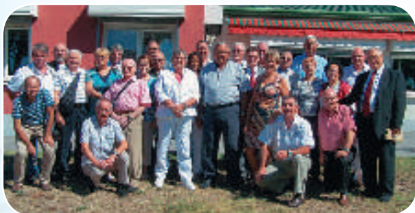
À l'issue de la matinée, une photo des participants qui témoigne de la bonne humeur et de la convivialité.