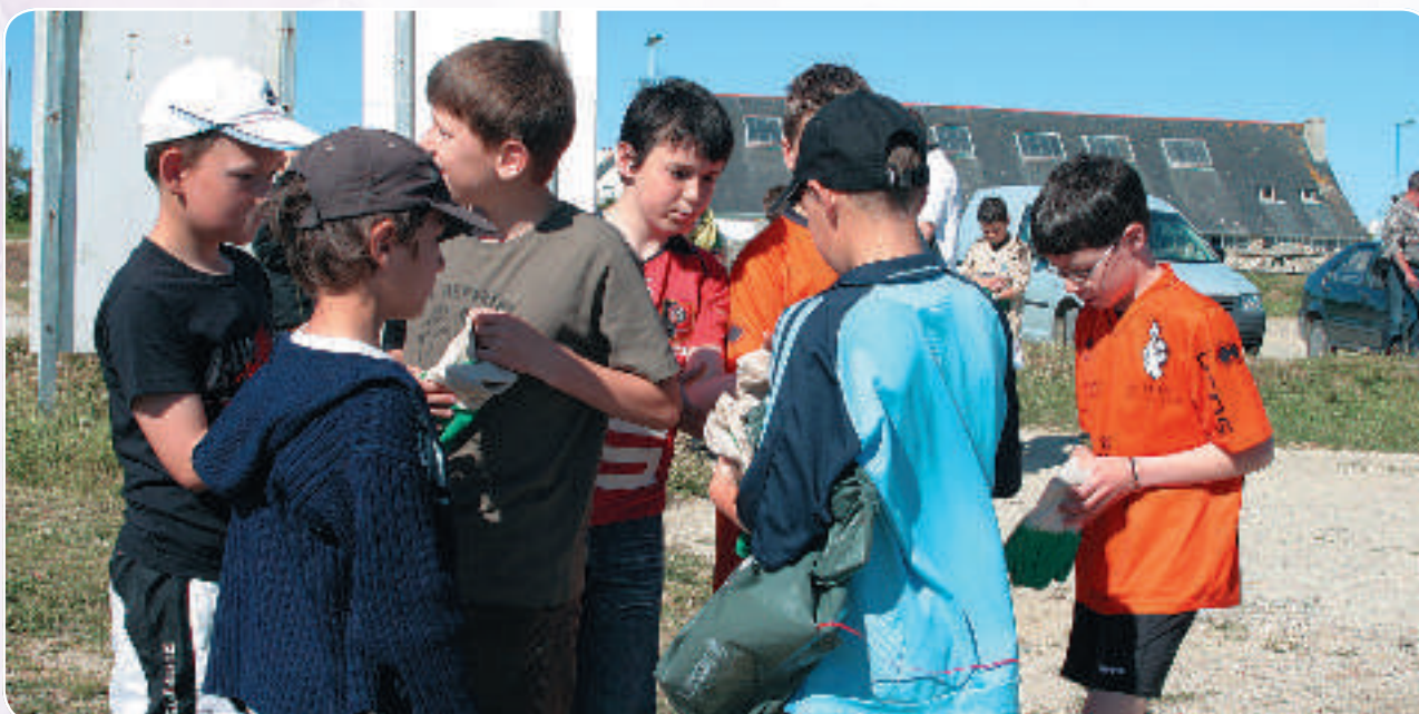
Distribution des sacs poubelles pour le tri sélectif et des gants, indispensables éléments pour une journée fructueuse.