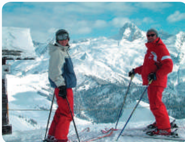
Le travail des hommes mérite le cadre dans lequel ils exercent leur activité.

Le sport est au cœur de la vie humaine. Il participe aux équilibres sociaux, économiques et au bien-être et à la santé des personnes.