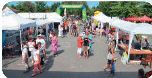
Une vue du village partenaires avec au premier plan le stand du CDMJS 65.