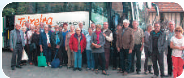
Le groupe sur le chemin du retour après une riche journée.

Une trentaine de courageux se sont retrouvés dès potron-minet pour passer une journée à la ferme du cheval de trait "La michaudière". Un petit-déjeuner, une promenade en carriole, la visite de la station thermale de Bagnoles de l'Orne, un déjeuner suivi d'un spectacle de percheros et un petit verre de cidre, le tout sous un beau soleil automnal, il n'en fallait pas plus pour ramener d'excellents souvenirs.