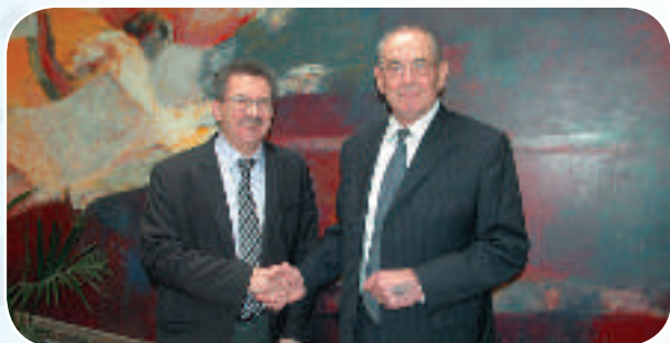
Le nouveau et l'ancien (à droite).