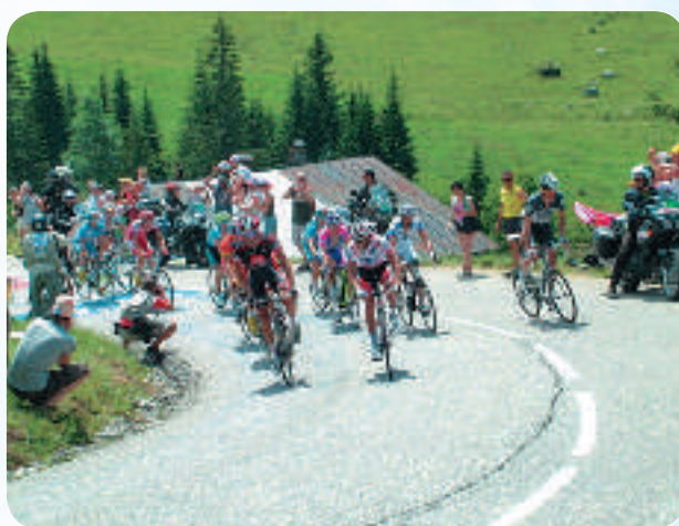
Les étapes de montagne sont toujours les plus belles... La nature doit rester propre après la manifestation sportive.