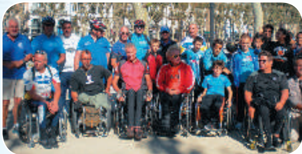
Le coup d'envoi vient d'être donné.

A la demande des organisateurs, ce partenariat sera certainement reconduit en 2014.