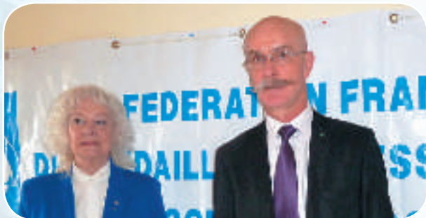
Lors de la passation de pouvoir.

Un nouveau président et un bureau renouvelé pour le comité départemental des médaillés de la jeunesse et des sports de la Dordogne.