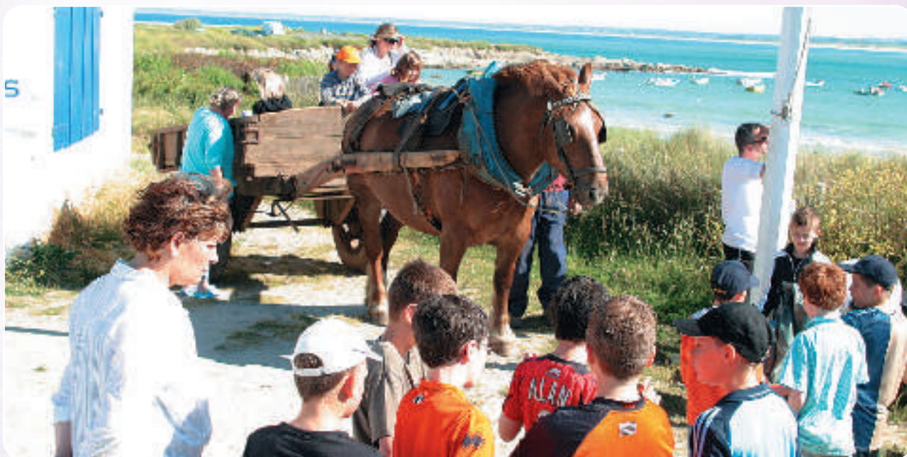
En route vers la plage toute proche.

Premiers acteurs au cœur de l'action puisque leur deuxième terrain de jeu se trouve être, aussi, la plage. Prise de conscience pour ces jeunes car leur terrain de jeu ressemble bien souvent à une poubelle en plein air. C'est donc de la responsabilité de chacun que, tous, ont pris la décision qu'il y avait certainement quelque chose à faire. Une journée nettoyage de la plage fut donc décidée.