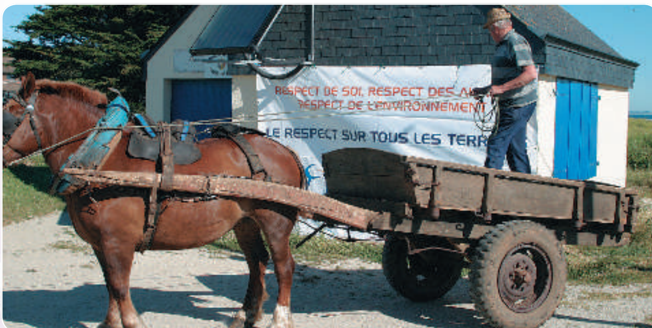
Quelly est prête pour sa journée de travail.

Dès 10 h du matin, l'impatience de cette trentaine de pousses étaient à son maximum. Tandis que la charrette était déjà prête avec la jument Quelly, les dernières consignes étaient rappelées, la distribution des sacs de différentes couleurs pour un tri sélectif et les gants indispensables. Les jeunes, accompagnés chacun par un adulte pouvaient se lancer dans cette aventure. Au total ce sont deux charrettes bien remplies qui ont fait l'objet de cette collecte.