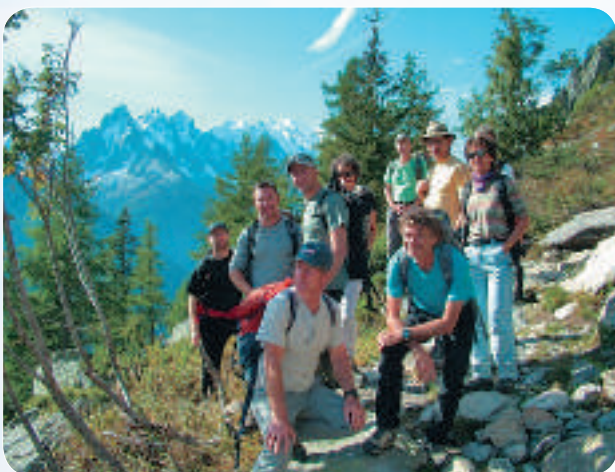
La montagne pour une pratique durable.

Toutes ces actions devraient se retrouver dans une charte du sportif, respectueux de l'environnement et des conditions de mise en œuvre de l'activité sportive, pour préserver l'avenir de nos enfants.