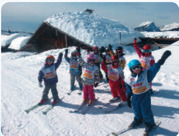
La joie des enfants au cœur des alpages.