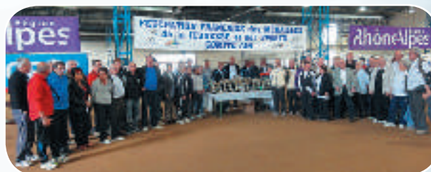
Une nombreuse assemblée qui a apprécié cette journée conviviale, et qui a félicité l'organisation du comité de l'Ain