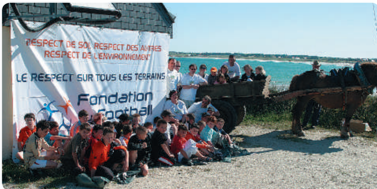
Les Jeunes posent pour la photo souvenir avant de participer à la journée nettoyage des plages en compagnie de Quelly, la jument qui sera chargée de récolter les déchets dans sa charrette.

Est-ce que nous n'apprenons pas aux plus jeunes à montrer l'exemple et à les responsabiliser afin que, demain, ils fassent en sorte d'avoir également un respect pour leur planète ?