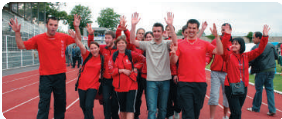
Des bénévoles en action aux Olympiades du Vivre Ensemble.

Chacun devrait mesurer l'ampleur de l'irremplaçable fonction sociale qu'exerce le bénévole et savoir ce qu'il en coûterait si le bénévole n'existait pas. Par sa présence il assume un véritable service public.