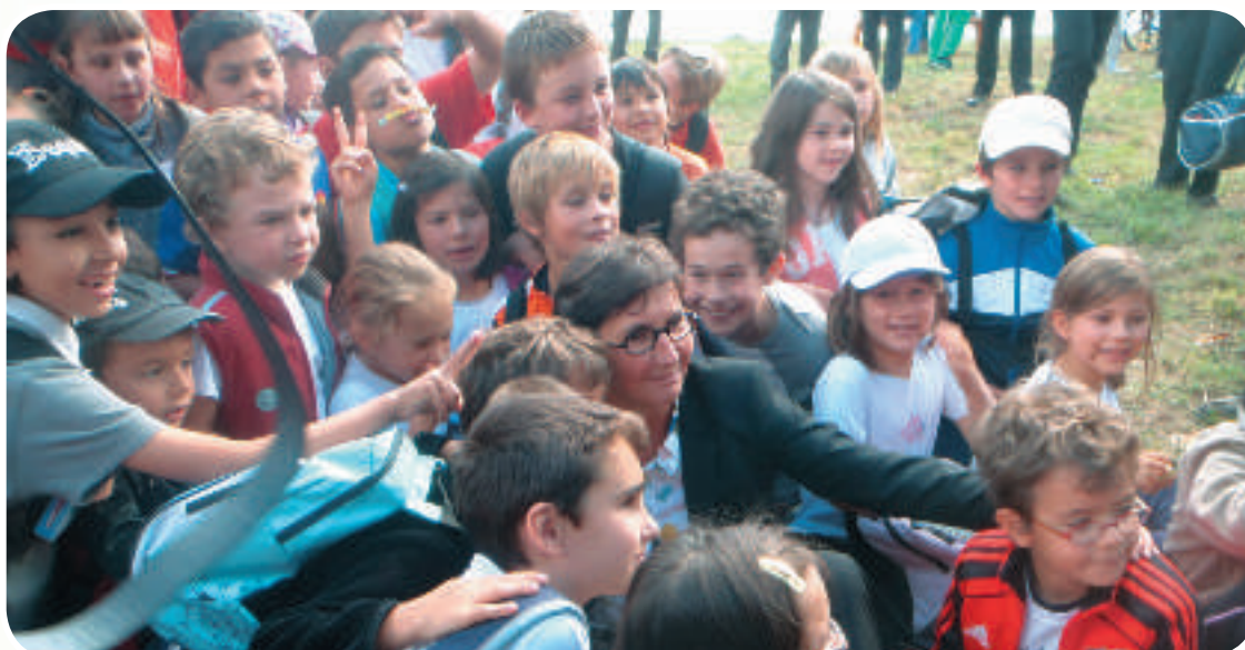
La Ministre des Sports Valérie FOURNEYRON au milieu des enfants lors de la Journée Nationale du Sport Scolaire à Versailles le 19 septembre 2012 à Versailles

Actualité de rentrée oblige, nous avons décidé de consacrer le présent numéro au Sport à l'École. Bien entendu, il faut entendre le Sport à l'École dans sa globalité, à savoir d'une part, l'enseignement de l'éducation physique et sportive dans le cadre des programmes scolaires, et d'autre part, le sport scolaire qui propose des activités sportives multiples et variées dans le cadre des associations sportives scolaires, à tous les élèves scolarisés en primaire, au collège et au lycée.