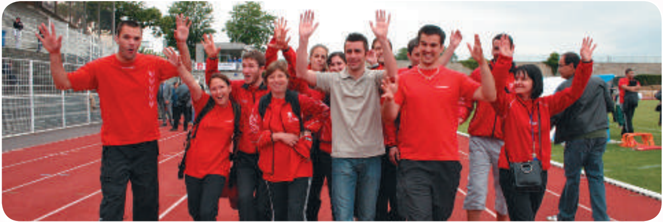
Des bénévoles en action.