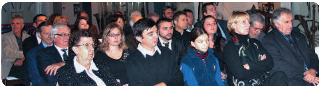
Une assistance attentive.