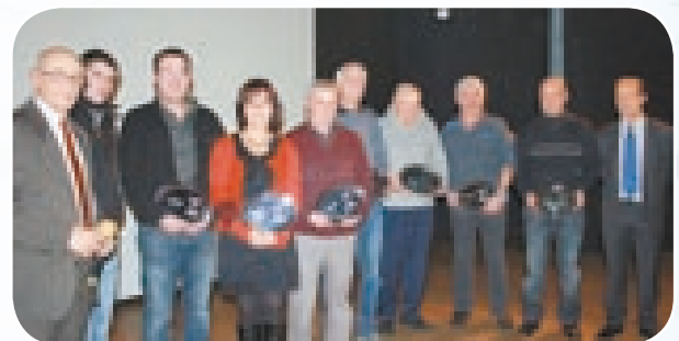
Les récipiendaires pendant la cérémonie.