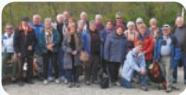
Un groupe aguerrri à toutes épreuves.