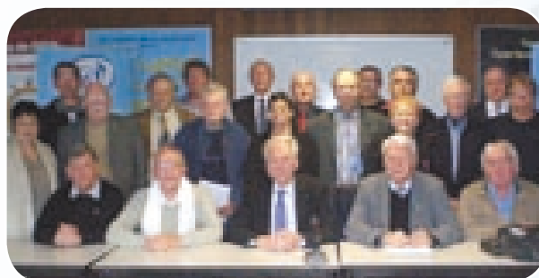
Le Président Roland LOOSES entouré des Membres de l'Instance Dirigeante des deux Comités Départementaux